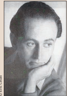
Paul Celan, Wien 1948