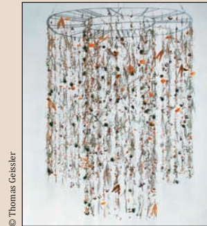
Kunstinstallation Evalie Wagner